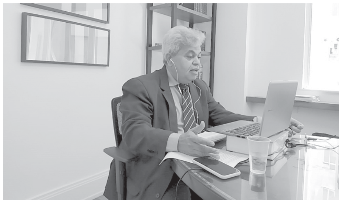
Deputado diz que objetivo é aumentar a competitividade e garantir a vinda de novos empreendimentos para nosso Estado