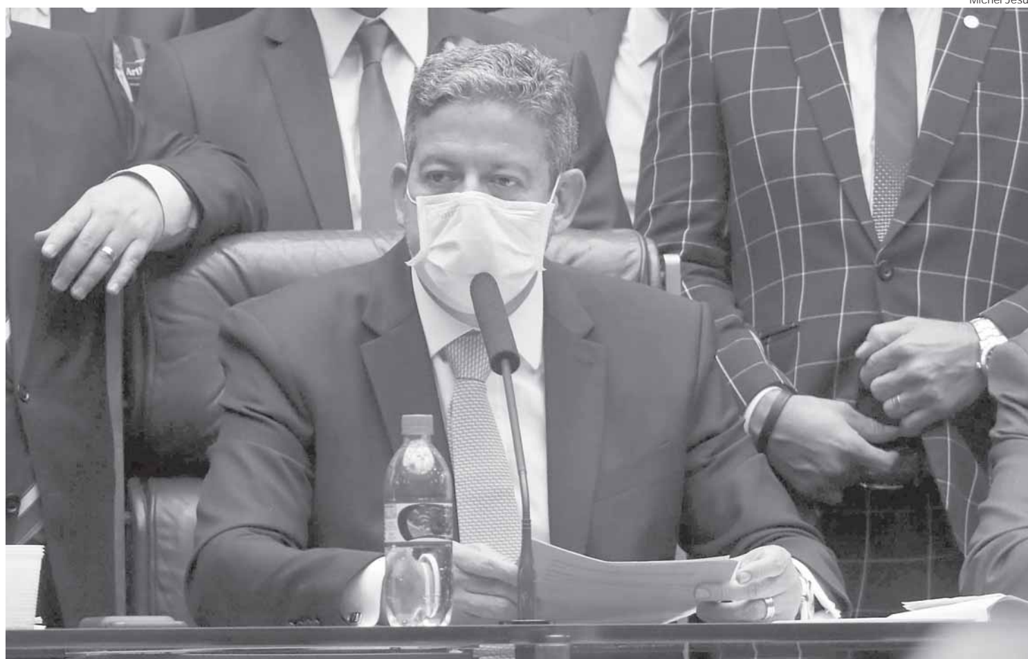
Argumentos de 122 pedidos já apresentados à presidência da Câmara foram apresentados nesta quinta-feira ao presidente da Casa