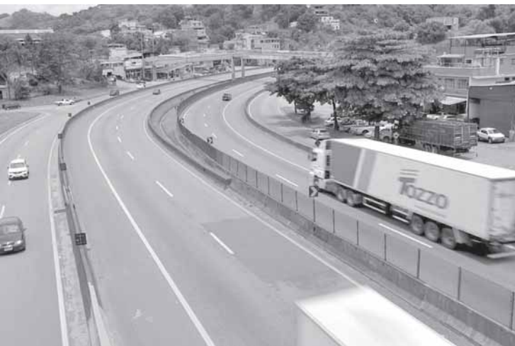
Audiência discutirá construção de passarelas e viadutos na Rodovia Presidente Dutra