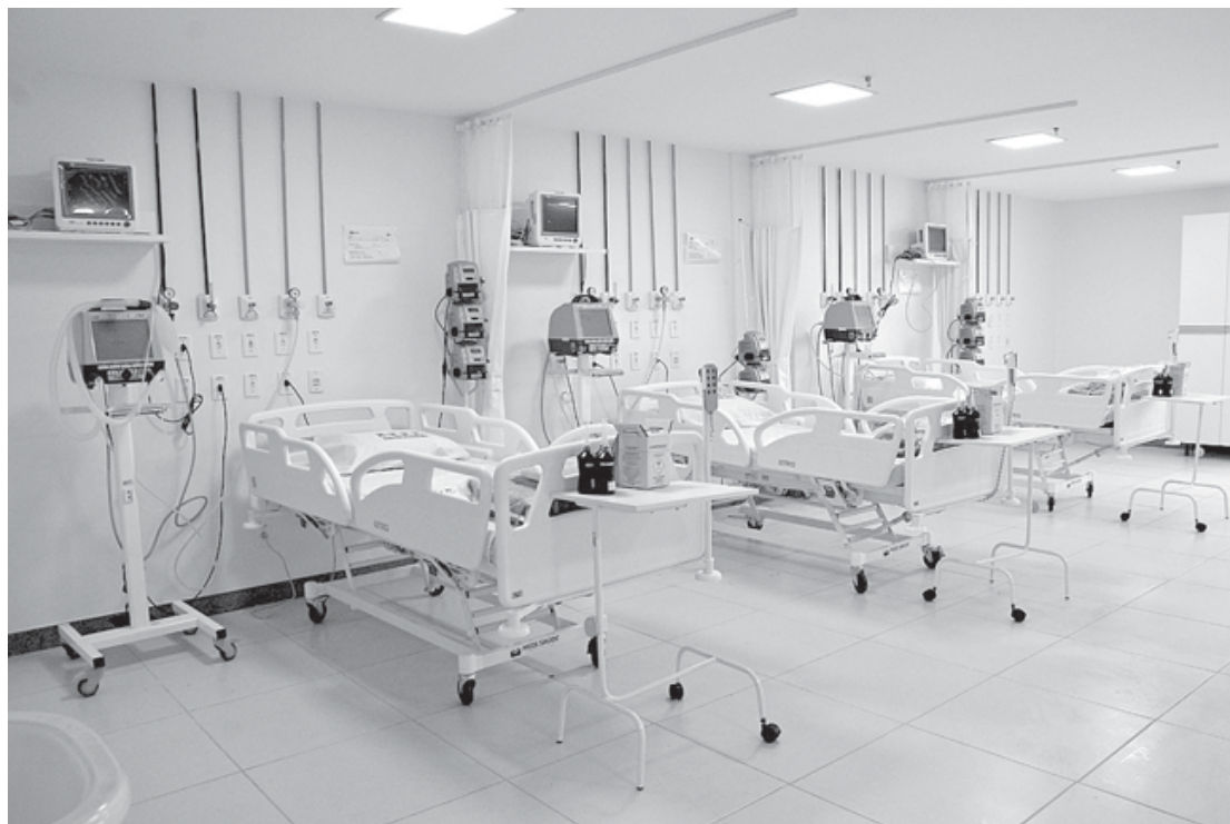
Todos os leitos estão equipados com respiradores e monitores

No início deste ano abrimos 10 leitos de UTI, 46 de Clínica Médica e outros quatro de unidades