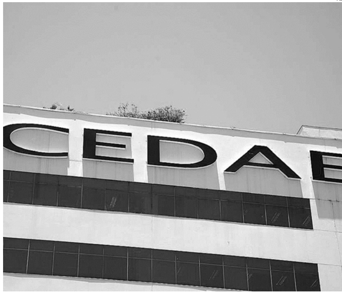
Leilão da Cedae foi dado como garantia do estado do Rio para aderir ao Regime de Recuperação Fiscal

Na data de assinatura do contrato, o governo e a concessionária darão início ao período de operação assistida do sistema, com duração prevista de até 180 dias, no qual o es-