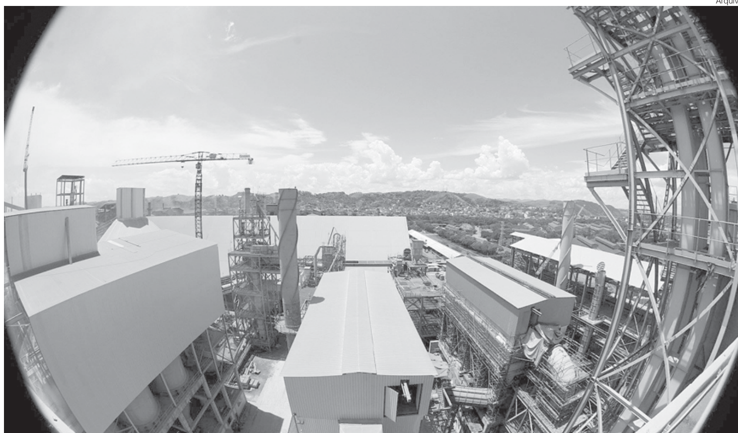
Avaliado em R$ 1,08 bilhão, o negócio envolve pagamento em caixa, aporte de capital e assunção de dívidas