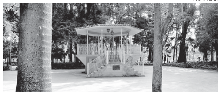
Serviço visa a melhora na qualidade de lazer dos munícipes que frequentam o local