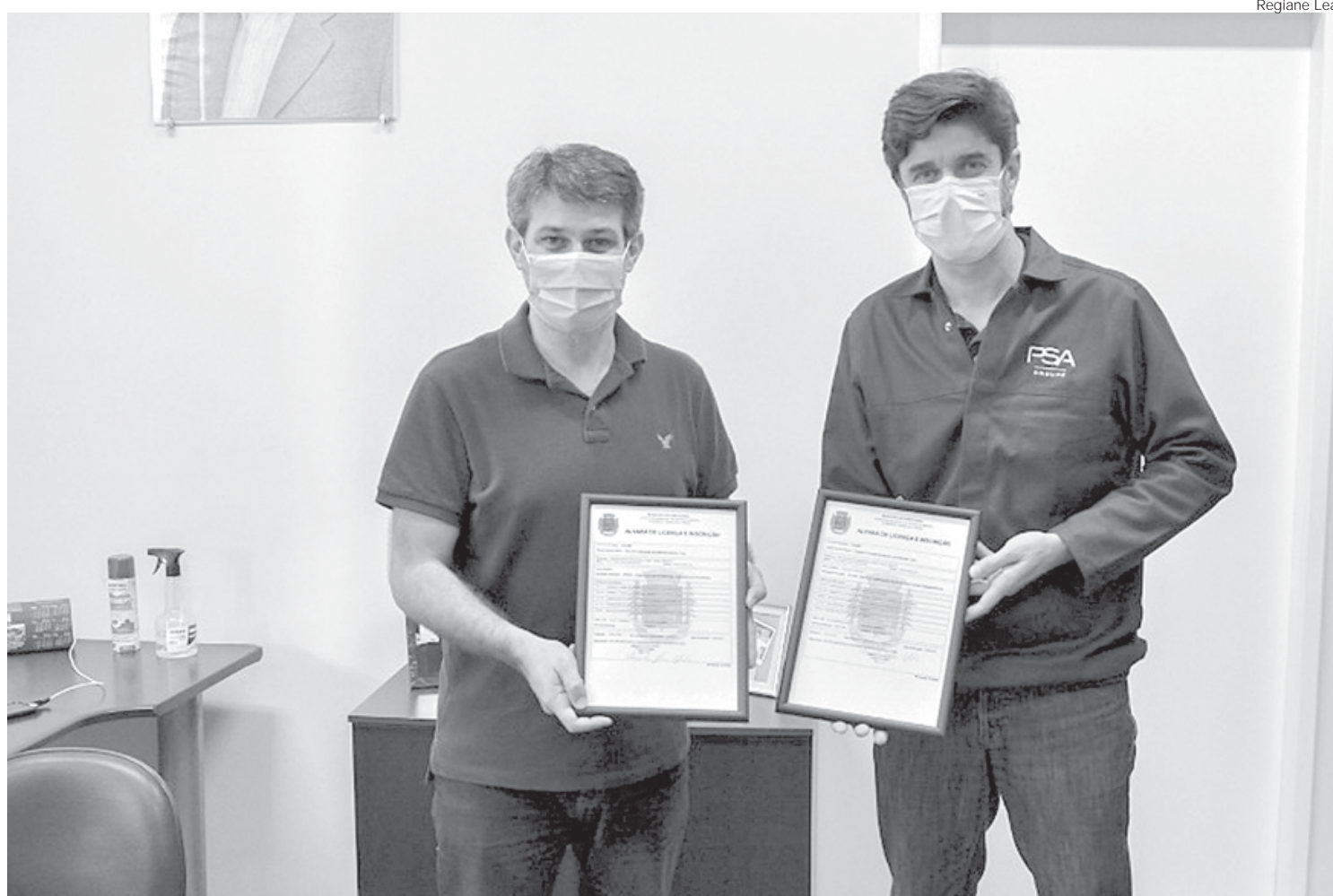
Empresa pretende contribuir para o desenvolvimento econômico da cidade